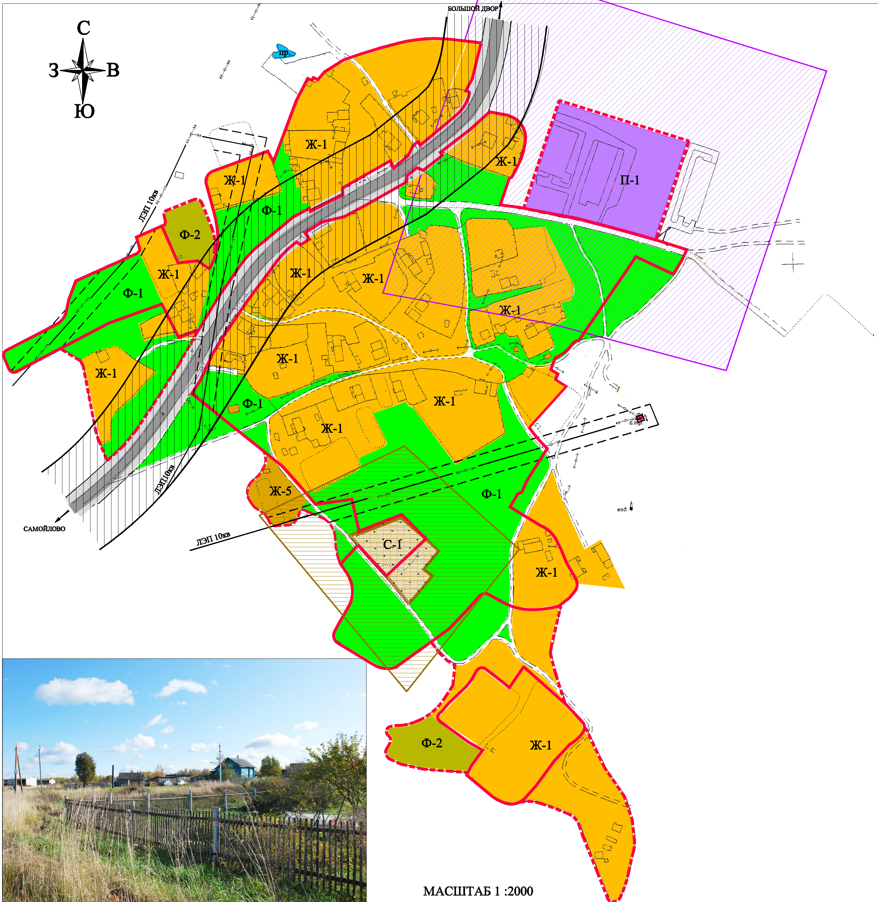
Фото д.Захожи. 2009г., октябрь.